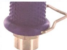
Druckauslöser Pressure trigger