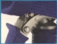
Stahl verstärkt und Push-Tropf-System steel reinforced and push-drip-system