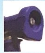
Stahl verstärkter Düsenkopf Steel reinforced nozzle tip