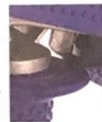
Texturiertes Griffstück Textured handle